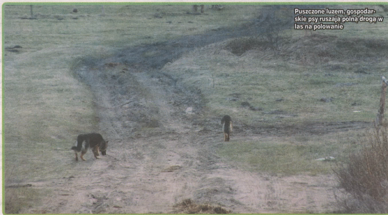
Puszczony luzem, gospodarskie psy ruszają polną drogą w las na polowanie

Puszczanie w lesie psów luzem może zakończyć się odłowieniem ich do schroniska